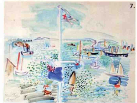
6. Boutique Chanel éphémère à Saint-Tropez, dans l'hôtel particulier La Mistralée. 7. Exposition « Raoul Dufy, les couleurs du bonheur », Musée Jean-Cocteau, jusqu'au 9 octobre 2017. 8. Bettina Graziani et Pablo Picasso à la villa La Californie, par Mark Shawn, exposition « Picasso primitif », au Musée du quai Branly jusqu'au 27 juillet 2017. 9. Eau de toilette La Colle Noire, Dior. 10. Villa Kérylos, d'Adrien Goetz (Grasset). 11. Claudia Cardinale sur l'affiche du Festival de Cannes 2017.