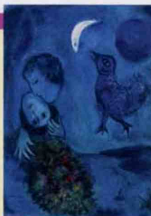
MARC CHAGALL, LE PAYSAGE BLEU, 1949, GOUACHE SUR PAPIER, 77 X 56 CM, VON DER HEYDT MUSEUM WUPPERTAL.

Eisenhower 75008 Paris Lundi, jeudi, vendredi, samedi et dimanche de 10h à 20h, mercredi de 10h à 22h Prix : 14 € / 10 € www.grandpalais.fr