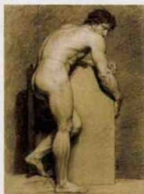
FRANÇOIS-XAVIER FABRE, PERSONNAGE NU SAISSANT UN CUBE DE PIERRE, DESSIN AU CRAYON NOIR AVEC REHAUTS DE BIANC SUR PAPIER, 58 X 44 CM.

Pendant la Révolution Française, une génération d'artistes a eu 30 ans. Le système artistique dans