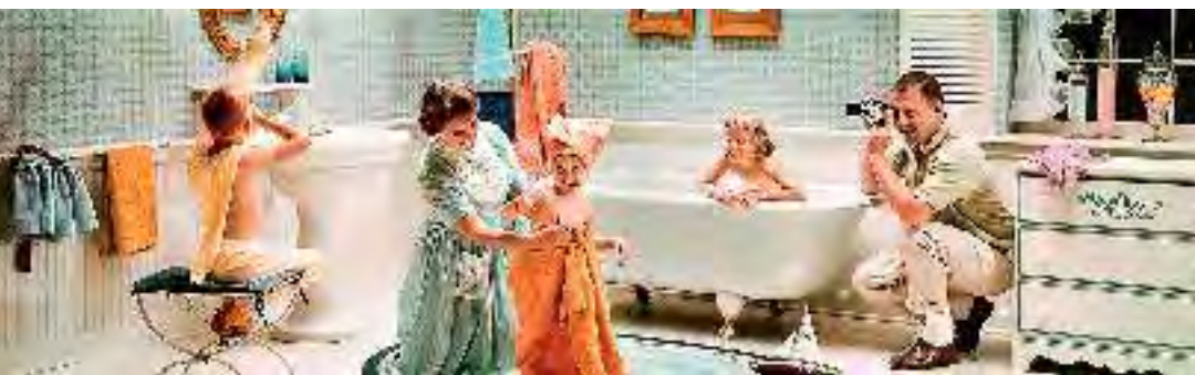
◀ Saturday Night Bath , photo prise par Lee Howick en 1964.

Parcourez cette exposition à la découverte de clichés mythiques qui dressent le portrait de l'American Dream au format cinémascope : 18 mètres de large sur six de haut ! Un format d'image particulièrement prisé dans l'univers de la publicité depuis les années 1950.