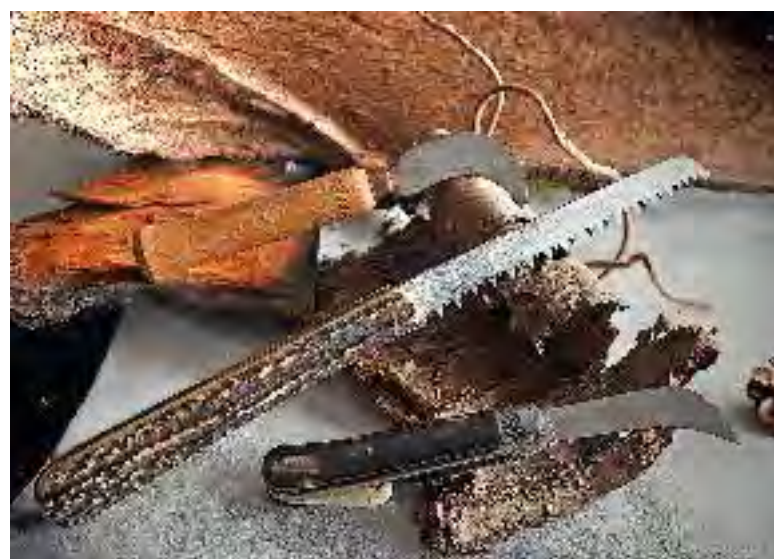
▲ Bien que confidentielle, la production d'outillage est toujours une spécialité du bassin de Nogent.

La programmation s'étoffe avec deux expositions temporaires. La première s'intéresse à Nicolas-Pierre Pelletier (1828-1921), artisan et artiste créateur de ciseaux en acier façonné. La seconde propose aux visiteurs de découvrir des outils anciens, montrant la diversité des accessoires du parfait jardinier.