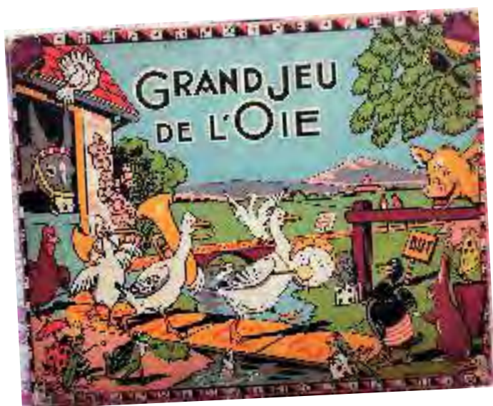
◀ Le Grand jeu de l'oie faisait partie des incontournables chez Saussine.

► L'aventure des jeux Saussine, à Uzès (30), jusqu'au 16 septembre, au musée Georges Borias. Ouvert du mardi au dimanche, de 15 h à 18 h. Tél. 04 66 22 40 23.