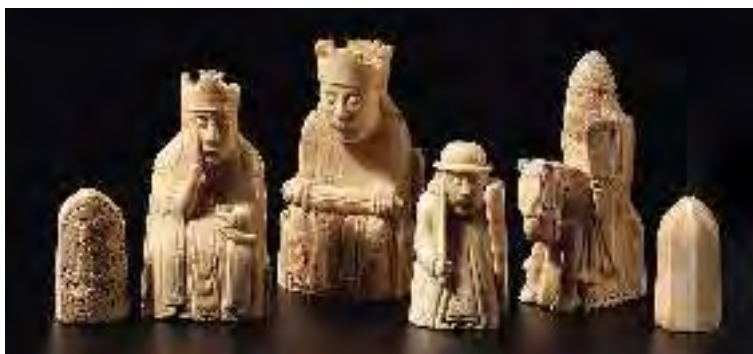
▲ Un échiquier de Lewis en ivoire, découvert en Écosse, probablement réalisé par les Vikings.

D'un galet de Tanzanie, datant de 2 millions d'années avant notre ère, aux lampes solaires actuelles, cette exposition s'attache à montrer comment nos sociétés ont évolué. Les objets, issus des collections du British Museum, nous font voyager aux quatre coins du monde et à travers les âges !