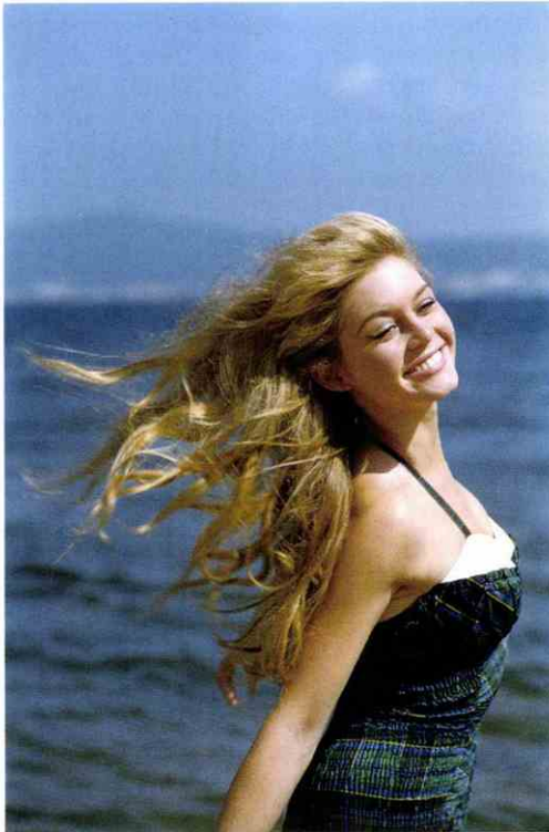
Brigitte Bardot à Saint-Tropez, en 1954. La starlette, qui tournera deux ans plus tard Et Dieu... créa la femme , affole déjà l'objectif.