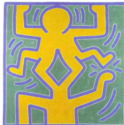
En haut, photo de Leïla Alaoui (2010), extraite de la série « Les Marocains ». En bas, toile de Keith Haring (sans titre, 1988). Deux artistes exposés cet été à la Collection Lambert en Avignon.

de Sorèze avec une promenade musicale autour des chants d'Espagne, suivie par Les Nocés de Figaro en plein air. www.festivalmusiquesoreze.com