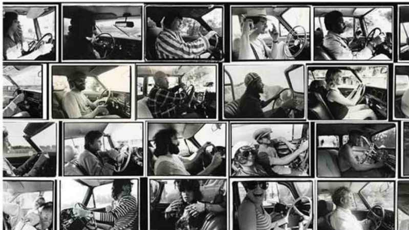
Photographies de la série Driving d'Annie Leibovitz.