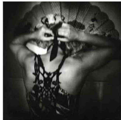
Série Moments Reflected d'Oyvind Hjelmén.

Autour des Moments Reflected du Norvégien Oyvind Hjelmén : par sa grâce et sa poésie en champ clos, la série semble recouvrir les êtres et les choses sous une cloche de silence. À découvrir dans le cadre de l'été arlésien et des «Rencontres off». Du 3 au 22 juillet. Galerie Joseph Antonin, 40, rue Émile-Barrère, 13200. Tél. 0676996944.