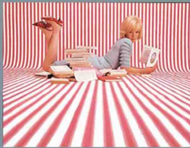
Jean-Marie Périer au BMW Brand Store à Paris.