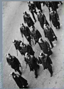
"68 ! la rue, la mode, les icônes" à la galerie Hegoa.

Lieu : BMW Brand store, 38 avenue George V, 75008 Paris. Date : Jusqu'au 10 juillet 2018.