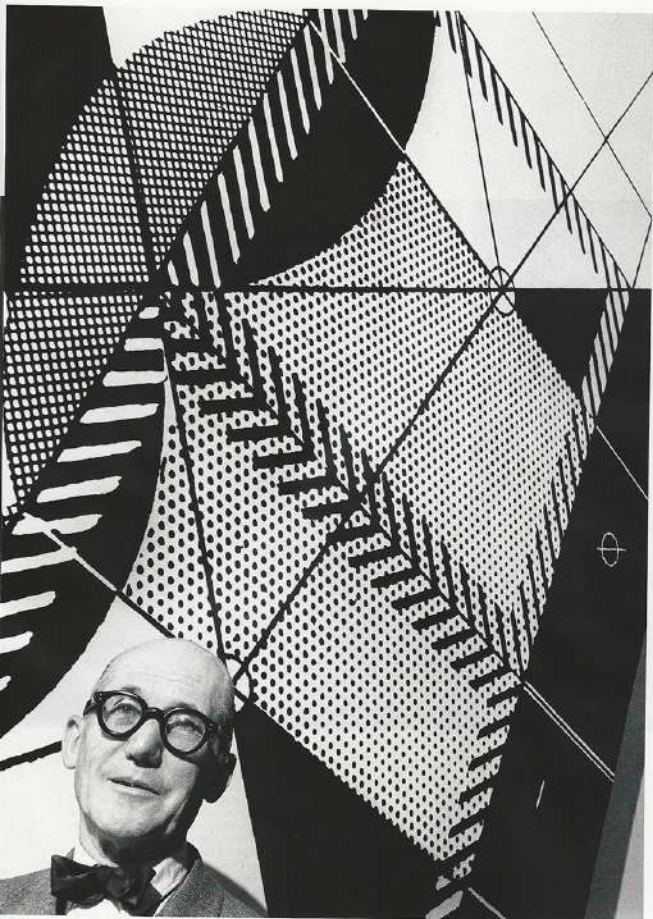
Page de gauche. Le Corbusier. Boulogne-Billancourt 1953. Page de droite, Coco Chanel et Paule Rizzo, première femme de Willy, Paris, 1990