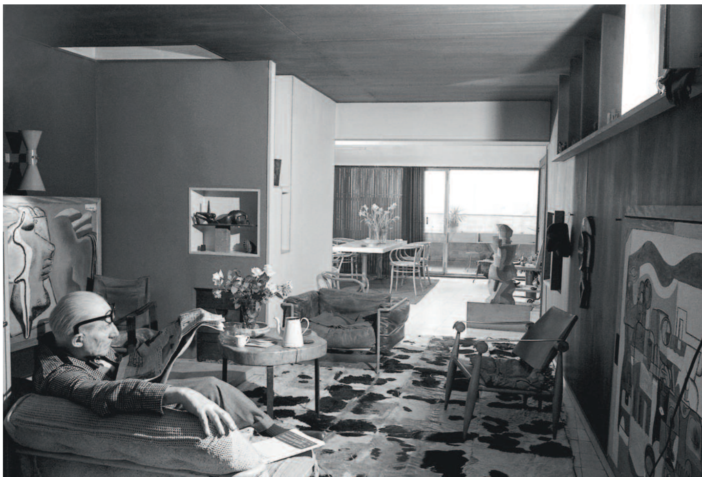
Le Corbusier in zijn studio en zijn privévertrekken. Het appartement in rue Nungesser et Coli in Parijs is te bezoeken.