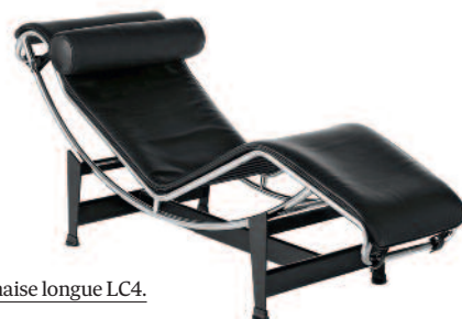
Chaise longue LC4.

De lampen van Perriand en Le Corbusier zijn sinds enkele jaren ook opnieuw verkrijgbaar, bij fabrikant Nemo Lighting.