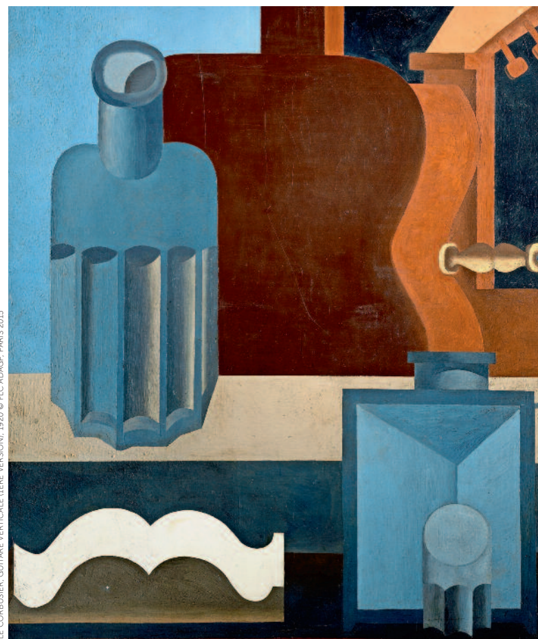
Tussen 1917 en 1922 stortte hij zich op het schilderen, in 1920 maakte hij 'Guitare verticale'.

Het radicale modernisme van Le Corbusier en Jeanneret was niet feilloos. Pierre en Eugénie Savoye moesten met een rechtszaak dreigen voor Le Corbusier ook maar iets ondernam tegen de waterlekken in hun witte blokkendoos.