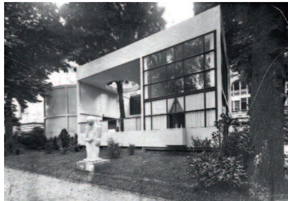
Pavillon l'Esprit Nouveau in Parijs, uit 1925, is intussen verdwenen.

LE CORBUSIER, PIERRE JEANNERET, MAISON GUIETTE © MAURY / VILLA SAVOYE © PAUL KOSLOWSKI / © FLC, ADAGP, PARIS 2015 © ADAGP, PARIS 2015