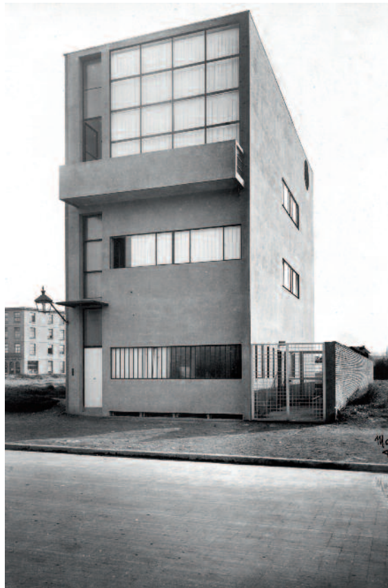
Zijn werk is ook te zien in Antwerpen dankzij Maison Guiette.