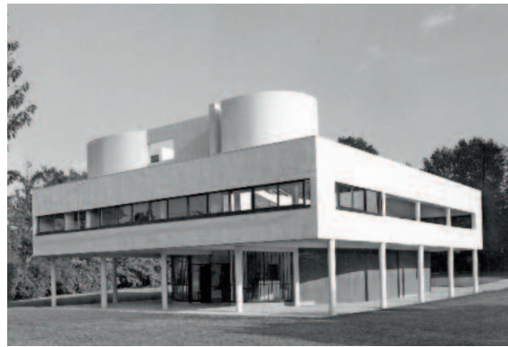
Villa Savoye: de eigenaars zaten met waterlekken door het ontwerp.