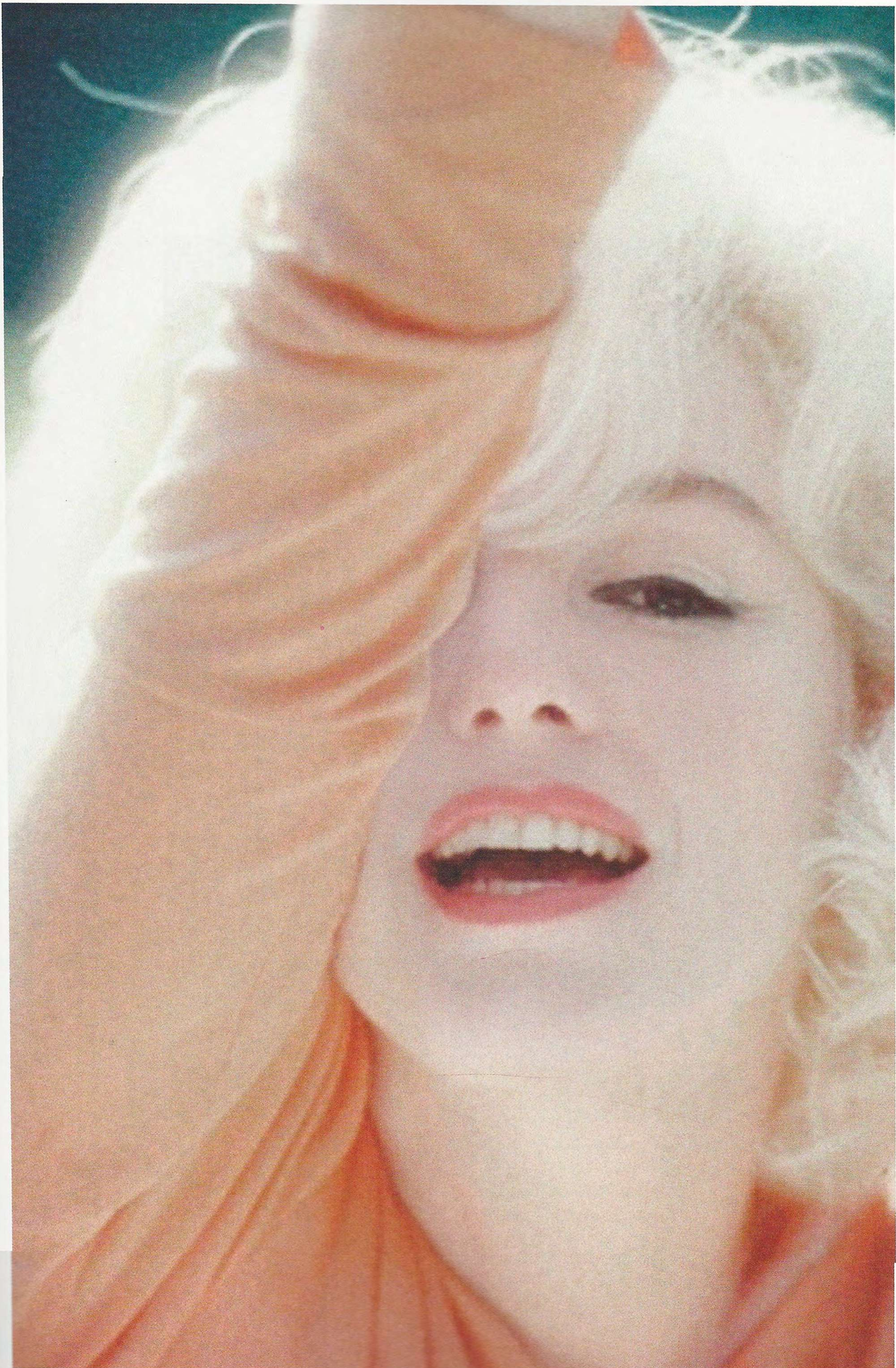
Willy Rizzo, Marilyn Monroe, Beverly Hills, 1962